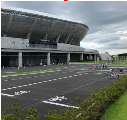
駐車場トイレ横に 自転車駐輪場設置