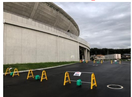
1500mスタート側 ゲート外側に 臨時駐輪場設置