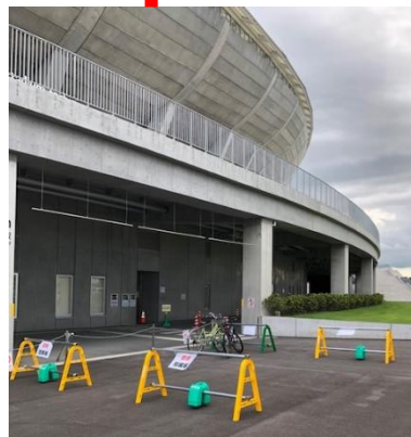
100mスタート側 ゲート外側に 臨時駐輪場設置